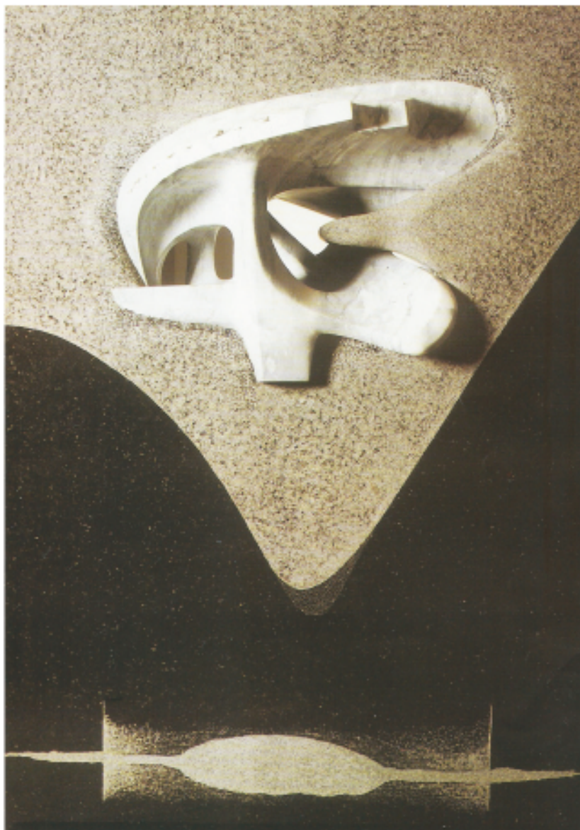
FRABRICIANO GÓMEZ Nudo en un espacio Mármol - granito 200 x 150 x 60 cm Bienal de Venecia 1980 Colección MF