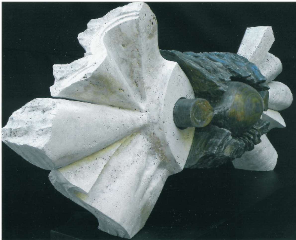
WELSCHEN, HÉCTOR "Algo nos une" Mármol travertino y madera palo santo