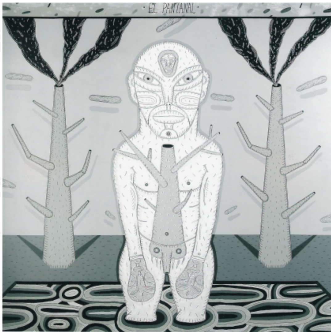
PERROTTA, DIEGO "El pantanal" Esgrafiado sobre tela