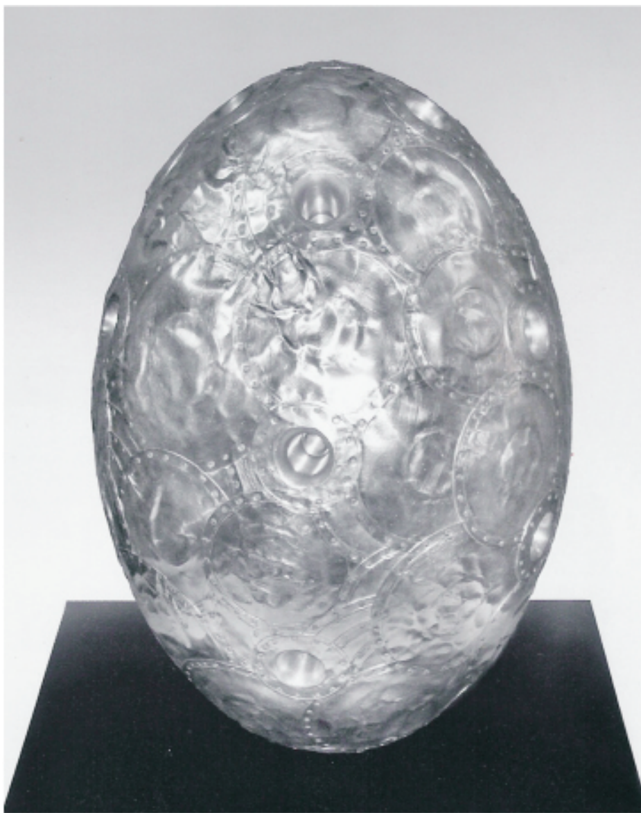
CAUSA, MARÍA "Huevo" Aluminio (tapa de cacerola y budinera)